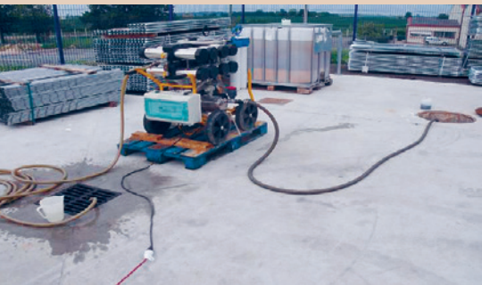
Mit der Ultrafiltrations-Anlage lassen sich grosse Waschwassermengen behandeln, CCD