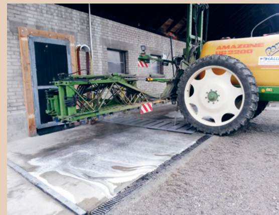
Ein eingerichteter Reinigungsplatz unter einem Vordach mit Drainagegitter und Ablauf in Rückhaltetank, Th. Haller