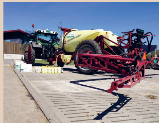
Spritzenreinigung auf einem Platz, der in eine aktive Güllegrube entwässert, St. Berger