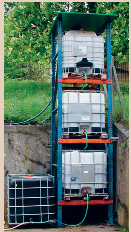
Das System Biofilter ist interessant, wenn das Sickerwasser für die Bewässerung genutzt wird, AGRIDEA