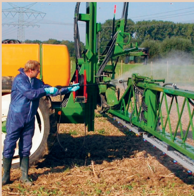
Reinigung einer Feldspritze auf der Parzelle, TOPPS

Beim Befüllen und Reinigen von Feld- und Gebläsespritzen besteht ein Risiko, dass konzentrierte Pflanzenschutzmittel (PSM) oder mit PSM verschmutztes Waschwasser in Gewässer gelangen können (punktuelle Einträge). Dieses Merkblatt bietet eine Übersicht der unterschiedlichen Möglichkeiten für das fachgerechte Befüllen und Reinigen der Spritze sowie den Umgang mit dem Waschwasser. Es hilft den Betrieben, in vier Schritten die am besten geeignete Lösung zu finden.