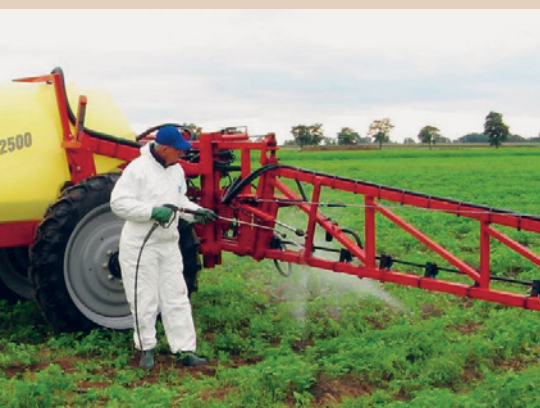
Reinigung einer Feldspritze mit einer Reinigungslanze, TOPPS