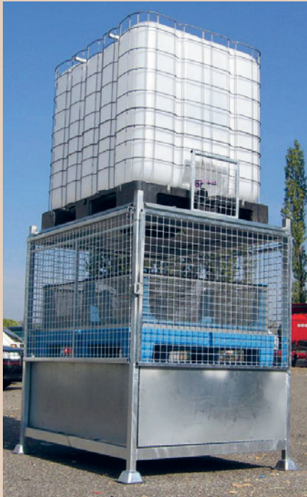
Das Osmofilm-System funktioniert rein physikalisch, dafür müssen die Rückstände entsorgt werden, CCD