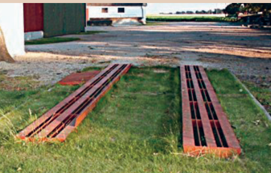
Das System Biobed kann direkt befahren werden und benötigt keinen separaten Füll- und Reinigungsplatz, M. Castillo

Alle biologischen Reinigungssysteme wie Biobed, Biobac usw. basieren auf Verdunstung des Wassers und Abbau der PSM-Rückstände durch Mikroorganismen. Das System besteht aus einem mit Substrat gefüllten Behälter, auf den das Waschwasser ausgebracht wird. Um Regenwasser abzuhalten, sollte der Behälter überdacht sein. Die Mikroorganismen sind auf aerobe Verhältnisse angewiesen. Das Waschwasser muss daher dosiert ausgebracht und allfälliges Überschusswasser abgepumpt und wieder eingespeist werden. Eine Begrünung des Substrats erhöht die Verdunstungsleistung. Herbizid-Rückstände können die Begrünung beeinträchtigen, was die Leistung der Anlage reduziert. PSM auf Basis von Schwermetallen (Kupfer) können von den Mikroorganismen nicht abgebaut werden und können sich anreichern. Bei häufigem Kupfer Einsatz ist der Einsatz eines Kupferfilters zu prüfen. Ansonsten besteht die Gefahr, dass das Substrat dereinst als Sondermüll entsorgt werden muss. Das Substrat sollte nach einer gewissen Nutzungsdauer ersetzt werden. Das alte Substrat muss dabei breitflächig auf der Nutzfläche ausgebracht werden.