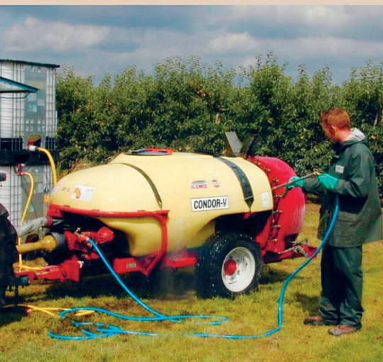
Reinigung einer Gebläsespritze auf einer bewachsenen Fläche, TOPPS

Maschinenhallen usw. Es ist zu prüfen, ob ein solcher Platz allenfalls mit geringen baulichen Anpassungen für die Reinigung der Spritze aufgerüstet werden kann. Die Anforderungen an den Platz können je nach Kanton abweichen (Überdachung, Regenwassertrennung usw.). Deshalb sollte die zuständige kantonale Stelle (Amt für Gewässerschutz) bereits bei der Planung einbezogen werden.