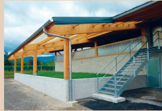
Biobac der Kollektivanlage in Dardagny, AGRIDEA

Eignung: Für wenige Reinigungen oder für die jährliche Reinigung der Spritze vor dem Einwintern.