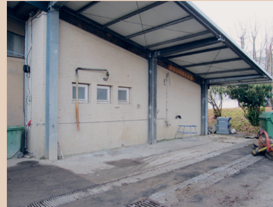
Platz zum Befüllen der Spritze mit Schlauchgalgen, Drainagegitter und Ablauf in Rückhaltetank. Bawendorf (D), B. Arnold

Aufrüstung bestehender Plätze: Oft ist der Platz der teuerste Teil einer Installation. Auf vielen Betrieben, bei Lohnunternehmen usw. bestehen Waschplätze für die Grobreinigung von Maschinen oder überdachte Plätze unter Vordächern,