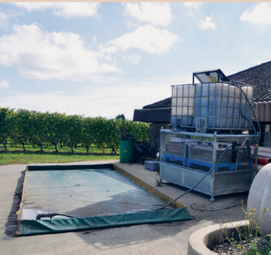
mobiler Reinigungsplatz mit Osmofilm-Anlage in Marcelin, M. Hochstrasser