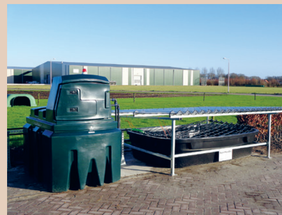
Das Phytobac®-System lässt sich modular erweitern, Beutech Agro